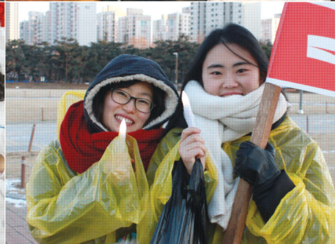
"성탄전야축제와 예수 탄생 거리대행진"